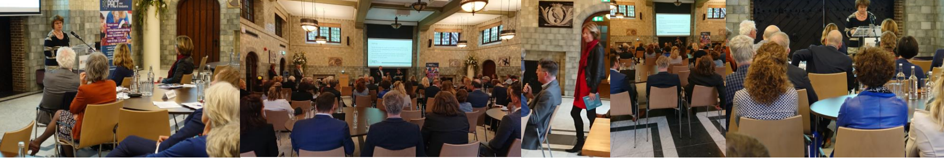
Mariëtte Hamer, voorzitter van de SER sprak over het belang van goede en toegankelijke kinderopvang en kindcentra voor alle kinderen.

“De SER heeft zich destijds gebogen over de vraag of kinderopvang effect heeft op de kinderen. De conclusie was dat kwalitatief goede kinderopvang een bijdrage kan leveren aan de ontwikkelingskansen van kinderen.”